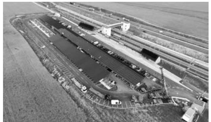
Luftbild P&R-Platz Bahnhof Merklingen Schwäbische Alb mit PV-Modulen

Seit kurzem laufen die Bauarbeiten, um Stellplätze mit einer Überdachung und Solarmodulen zu versehen. Insgesamt werden dadurch 260 überdachte Ladepunkte für E-Fahrzeuge hergestellt. Die entsprechenden Solarmodule werden aktuell auf den Carports installiert. Durch diese können bei einer Leistung von 862 kWp im Jahresdurchschnitt ca. 950.000 kWh Strom erzeugt werden. Die Arbeiten wurden in zwei Bereiche aufgeteilt, sodass immer ausreichend Parkplätze für die Bahnreisenden zur Verfügung standen.