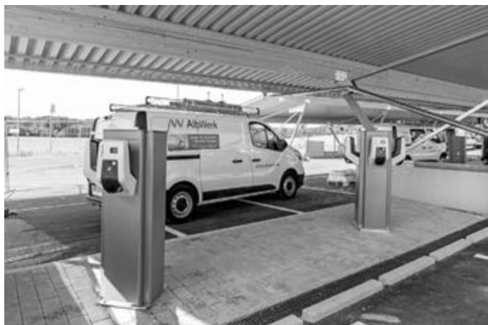
Ladesäulen mit je vier Ladepunkten