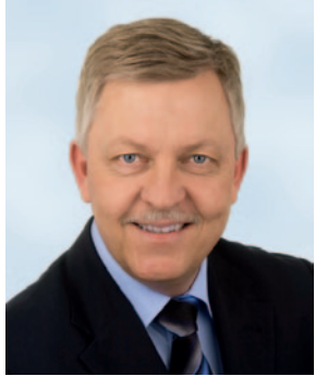
Bernd Mangold Bürgermeister Berghülen

„Die BürgerEnergiegenossenschaft Berghülen eG ist die ideale Rechtsform welche es der Gemeinde und den Bürgerinnen und Bürgern gemeinsam ermöglicht, sich sinnvoll vor Ort im Interesse des Klimaschutzes für die Energiewende einzusetzen.“