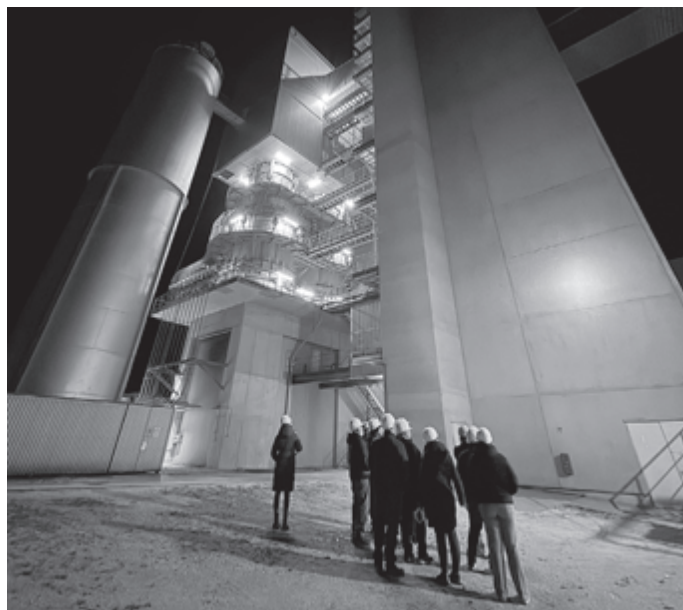
Wohin geht die Reise? Fahrt ins Blaue am 09. Mai!

Traditionelles Ostereierschießen (29.03.): Zum Monatsende bewiesen wir im Schützenhaus unsere Treffsicherheit und sicherten uns die begehrten Ostereier und Palmbrezeln.