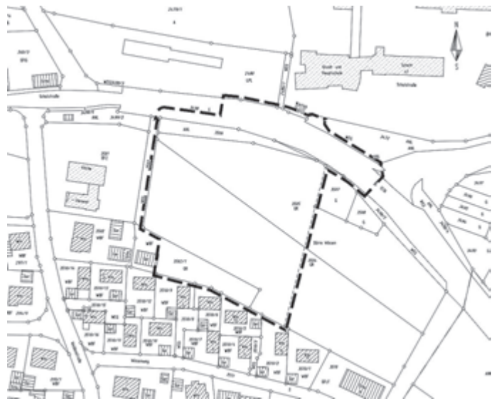
Lageplan „Dürre Wiesen“ vom 08.04.2025, unmaßstäblich, genordet

Der Gemeinderat der Gemeinde Berghülen hat in seiner öffentlichen Sitzung am 08.04.2025 beschlossen, den Bebauungsplan „Dürre Wiesen“ in Berghülen nach § 2 Abs. 1 des Baugesetzbuches (BauGB) und die Satzung zu den örtlichen Bauvorschriften nach dem Verfahren für den Bebauungsplan nach § 74 der Landesbauordnung in Verbindung mit § 2 BauGB aufzustellen. Das Plangebiet befindet sich am östlichen Ortsrand von Berghülen an der Schulstraße. Für den Planbereich ist der Lageplan des Ingenieurbüros Wassermüller Ulm GmbH vom 08.04.2025 maßgebend. Er ergibt sich aus folgendem Kartenausschnitt: