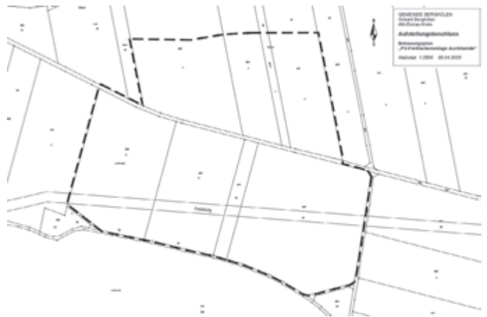
Lageplan „PV Freiflächenanlage Auchtweide“ in Berghülen vom 08.04.2025, unmaßstäblich, genordet

Für den Planbereich ist der Lageplan des Ingenieurbüros Wassermüller Ulm GmbH vom 08.04.2025 maßgebend. Er ergibt sich aus folgendem Kartenausschnitt: