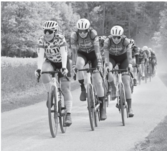
Das Rennen der Frauen