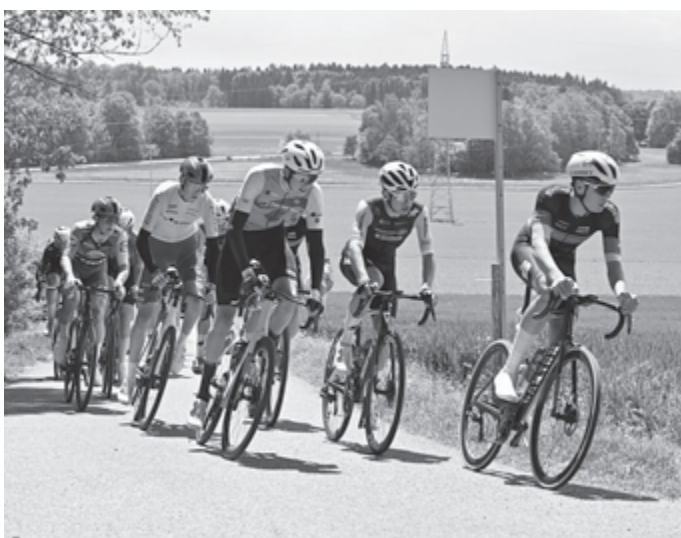
Die U19 Junioren